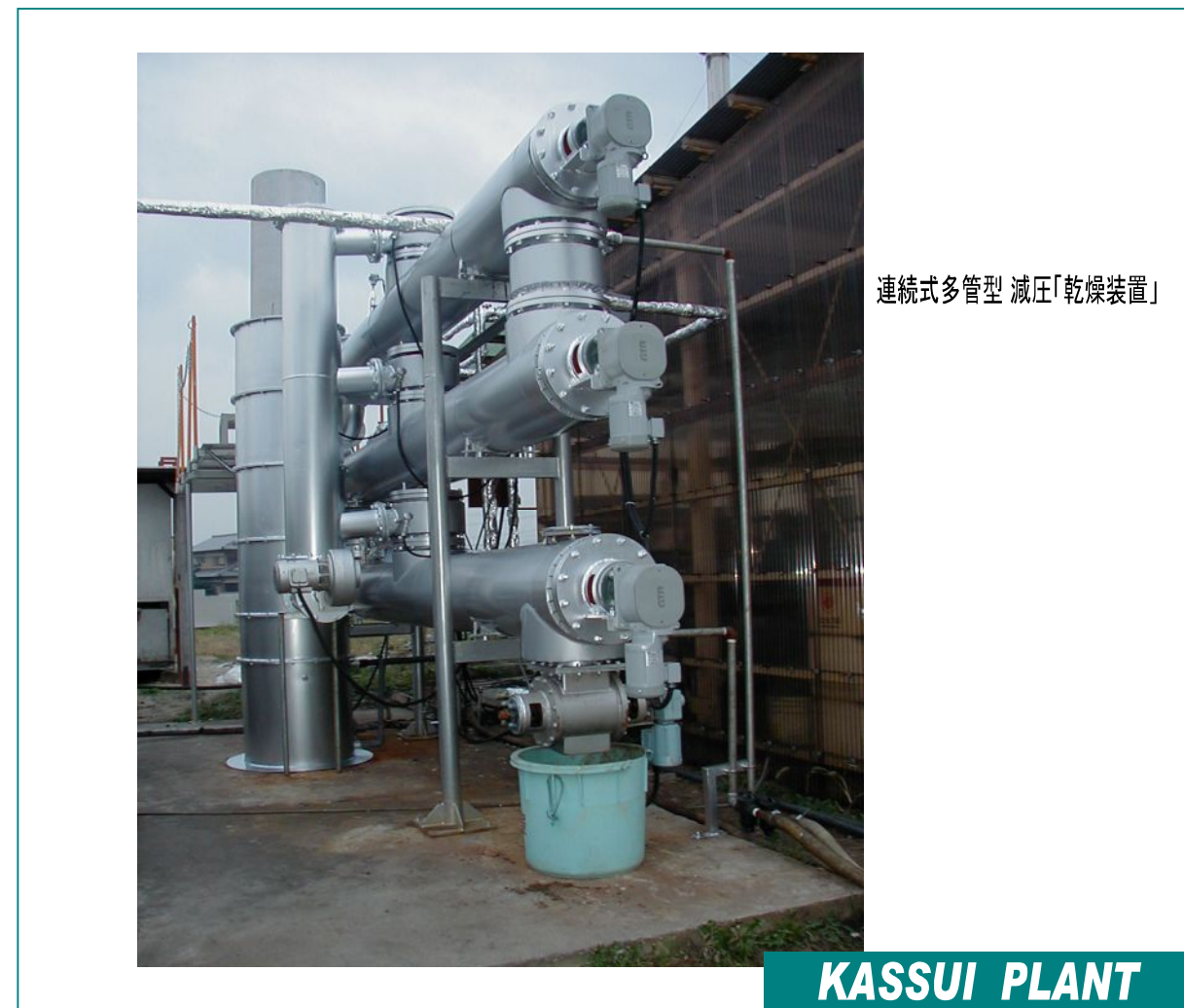
連続式多管型 減圧「乾燥装置」